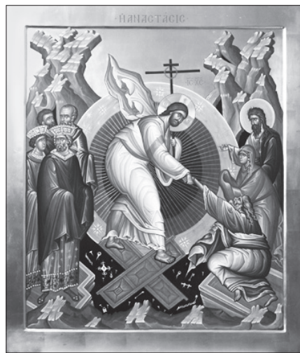
Сошествие во ад. Сийская иконописная мастерская.

В субботу за Божественной Литургией уже читается Евангелие о Воскресении Христа.