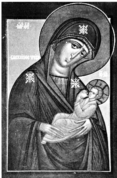
Икона Божией Матери «Блаженное Чрево».

«Слава в вышних Богу, и на земли мир, в человецех благоволение», — воспели Ангелы на небе, когда родился в Вифлееме Сын Божий. «Слава в вышних Богу» раздается во все века и поныне. Святки длятся от праздника Рождества Христова до Крещенского сочельника, установлены в воспоминание о Рождении и Крещении Господа нашего Иисуса Христа. Это дни особой радости. В святки нет поста, молящиеся не преклоняют колена. До 19 января не совершается Таинство брака.