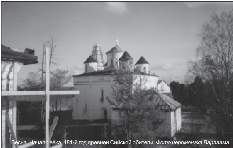
Весна. Начало века. 481-й год древней Сийской обители.