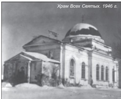
Храм Всех Святых. 1946 г.

Храм был приведен в полное запустение. Как свидетельствуют очевидцы, снесли купол и звонницу, разобрали полы и печи, замуровали окна, обрезали проводку, повредили штукатурку.