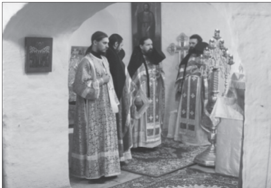
На снимке: во время Божественной литургии в Благовещенской церкви Сийского монастыря.