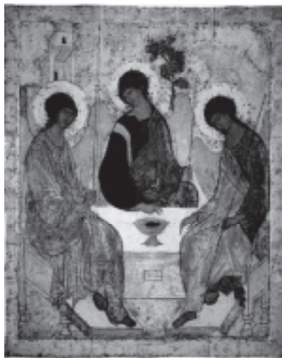
Андрей Рублев. Троица. Начало XIV в.

В этот же день — память равноапостольного царя Константина († 337 г.) и матери его царицы Елены († 327). Константин — первый из царей земных, кто стал распространять веру Христову в своем государстве, строил храмы, защищал св. веру от язычников и еретиков. Мать царя св. Елена обрела в Иерусалиме Животворящий Крест Господень, построила много храмов, щедро помогала бедным.