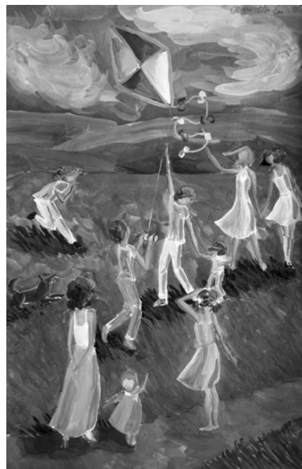
Рисунок Е. Светочевой. 13 лет.