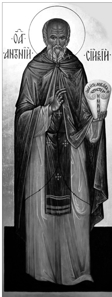
Преподобный Антоний Сийский чудотворец. Сийская иконописная мастерская.

19 декабря — святителя Николая, архиепископа Мир Ликийских, чудотворца († ок. 345 г.).