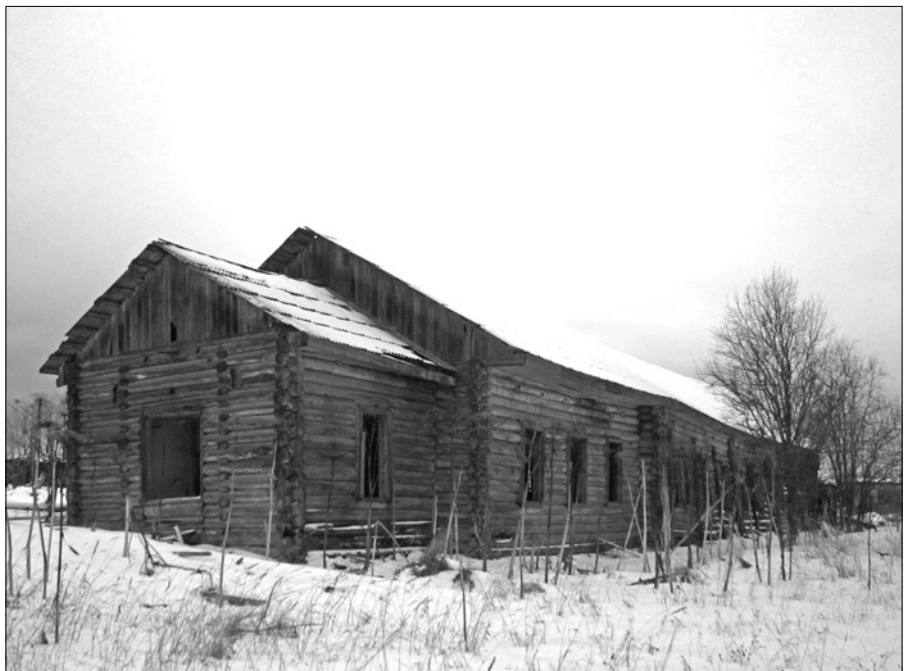
Мастерские в деревне Ватамановская — перевезенный из д. Красная Ляга Рождественский храм. Современный вид.

Для подготовки статьи использованы архивные материалы Федеральной службы исполнения наказаний Управления по Архангельской области, Управления внутренних дел по Архангельской области, Государственного архива Архангельской области, Архивного отдела МО «Каргопольский муниципальный район», материалы, хранящиеся в Каргопольском историко-архитектурном музее-заповеднике, информация из книги «За веру Христову. Духовенство, монашество и миряне Русской Православной Церкви, репрессированные в Северном крае (1918-1951). Биографический справочник» (Сост. С.В. Суворова. Архангельск, 2006).