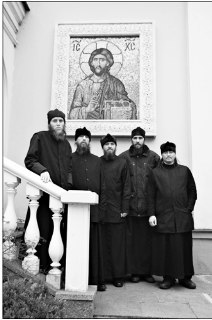
Студенты-первокурсники из братии Сийского монастыря.

ная среда, в которую я с уверенностью могу отправить братию. Выезды на сессию — пусть и кратковременные, на один месяц, — очень значимы. В это время происходит и смена обстановки (сродни отпуску), и в то же время сохраняется нужная нагрузка: братия и занимается интенсивно, и посещает богослужения. Во время сессии живут в общении на Иловойской, общение с православной молодежью полезно для них.