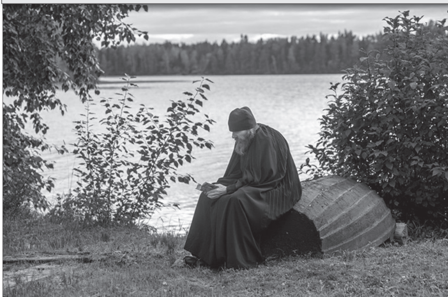
Молитва на озере.