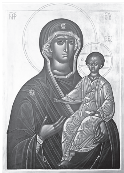
Смоленская икона Пресвятой Богородицы. Сийская иконописная мастерская.

Святого Пантелеимона мать воспитывала в христианстве, но отец отдал его в языческую школу, а затем обучал врачебному искусству. Юноша познакомился с христианским священником Ермолаем, который обратил его в христианство. Занявшись врачеванием, Пантелеимон раздал свое имущество бедным и стал лечить больных безвозмездно. Это вызвало ненависть других врачей, они донесли на Пантелеимона императору Максимиану, гонителю христиан. Святой был схвачен, его жестоко пытали, затем казнили. Но и по смерти своей он остался заступником и целителем больных и раненых, обращающихся к нему с молитвой. На иконах св. Пантелеимон изображается юношей, который держит в руках ларчик с лекарствами.