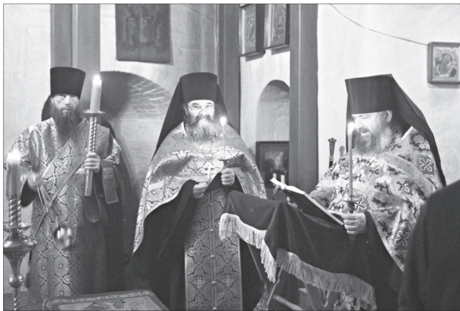
Фото иером. Феофила (Волика).