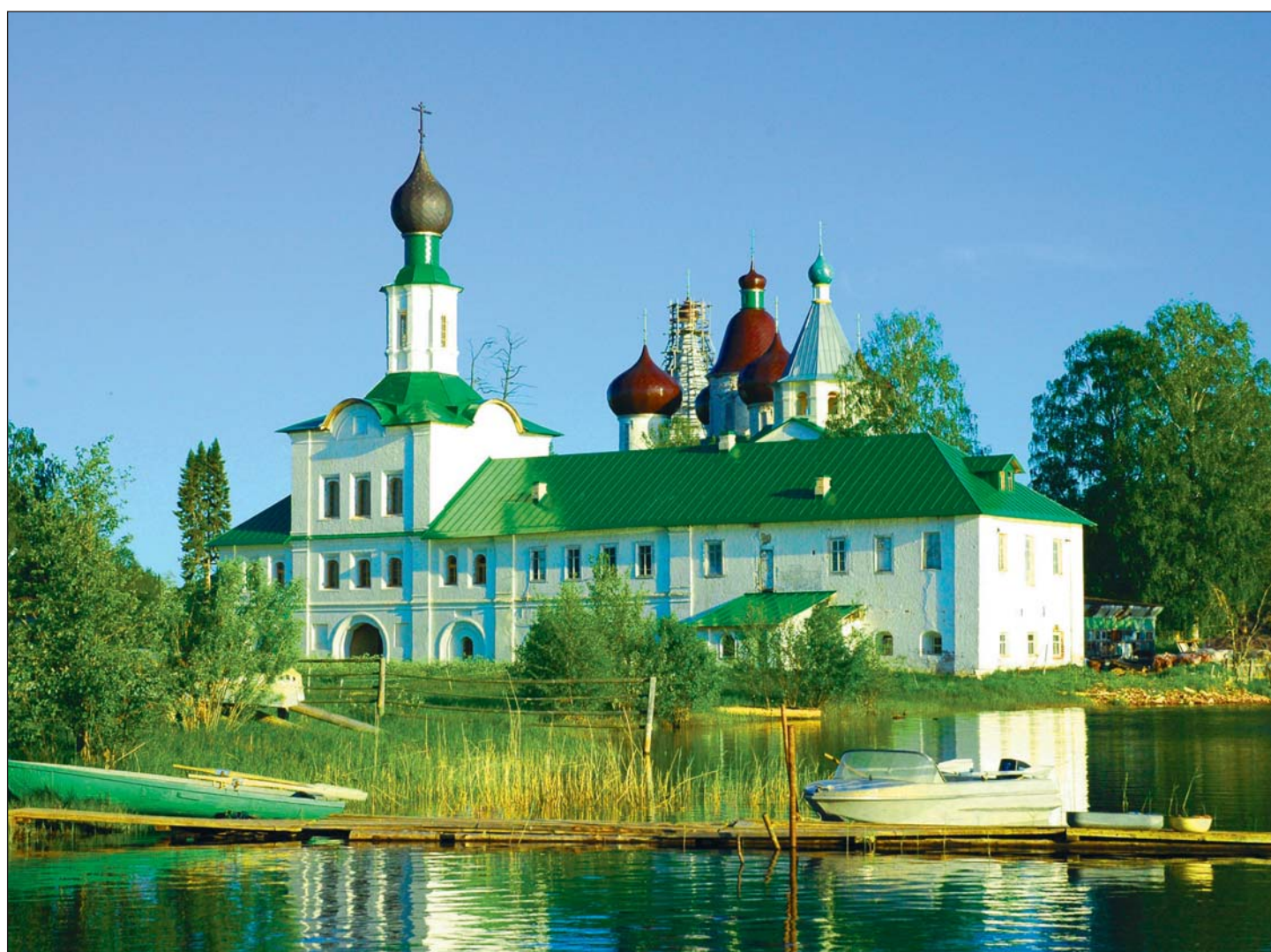
Белокаменная обитель...