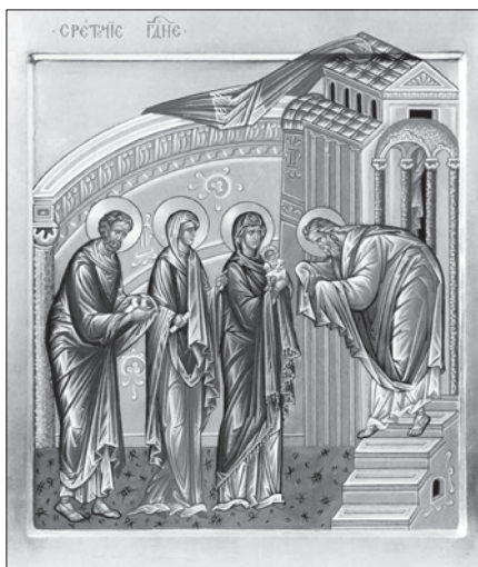
Сретение Господне. Сийская иконописная мастерская.

12 февраля — Собор вселенских учителей и святителей Василия Великого, Григория Богослова и Иоанна Златоустого.