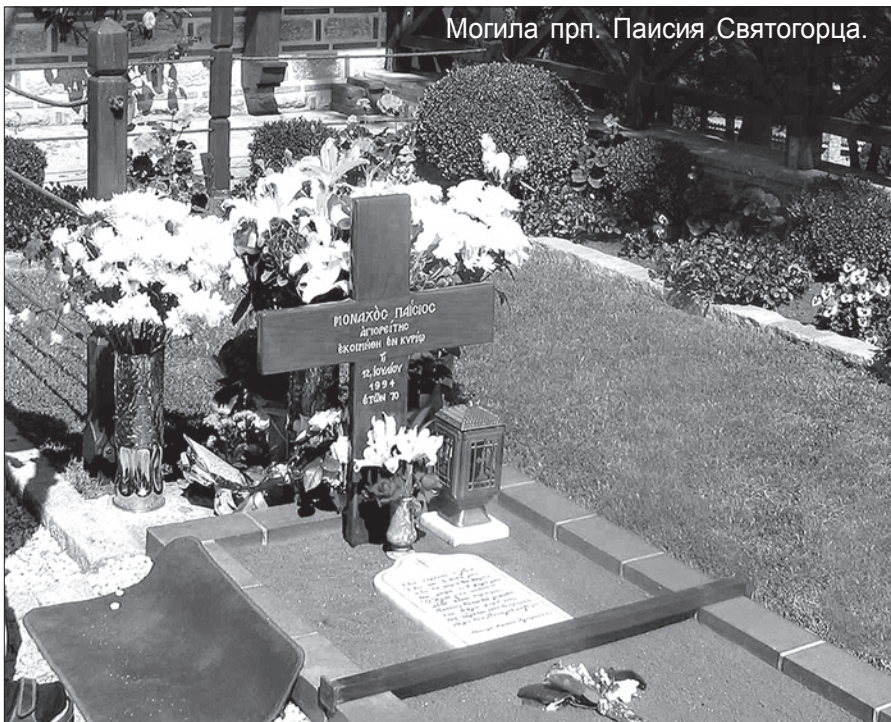
Могила прп. Паисия Святогорца.